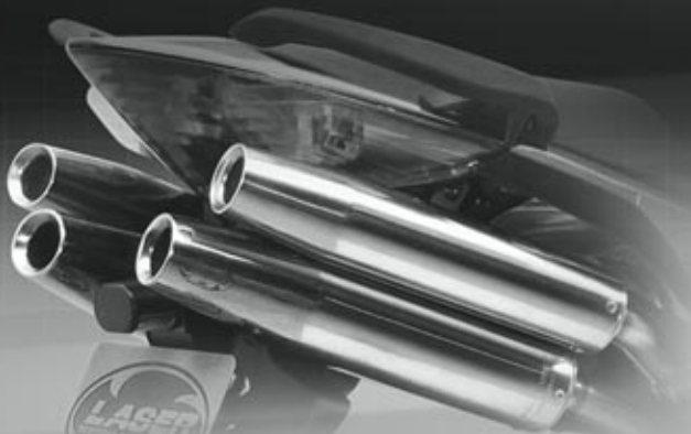
LASER X-TREME (4x TAPERED)