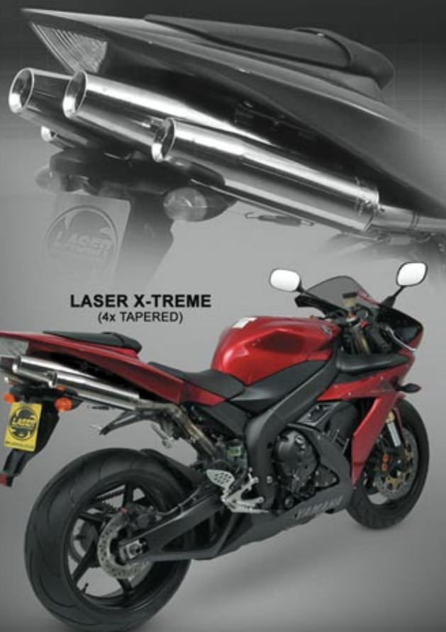
LASER X-TREME (4x TAPERED)