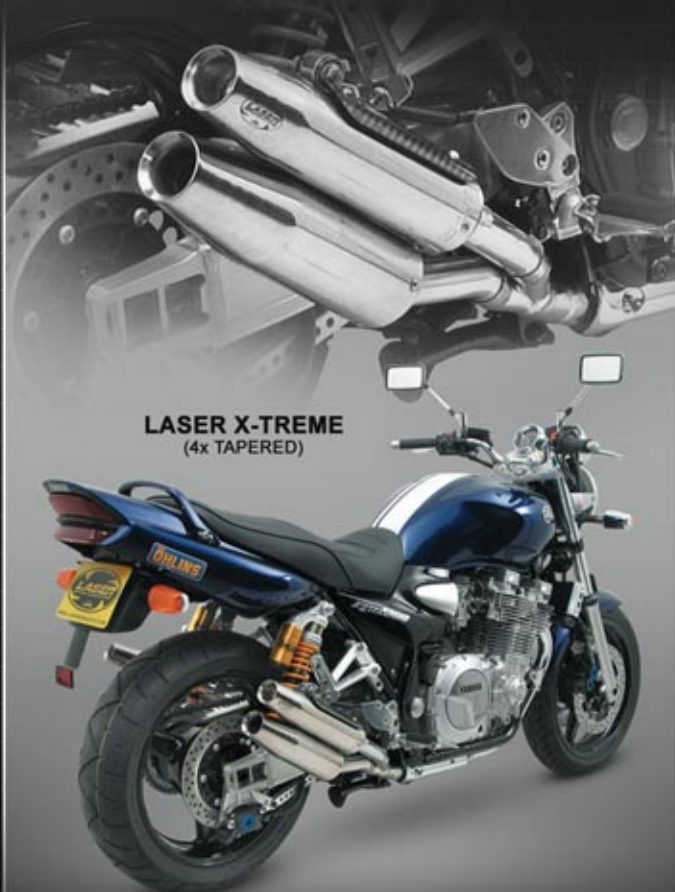
LASER X-TREME (4x TAPERED)