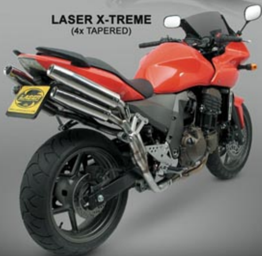
KAWASAKI Z750S '05