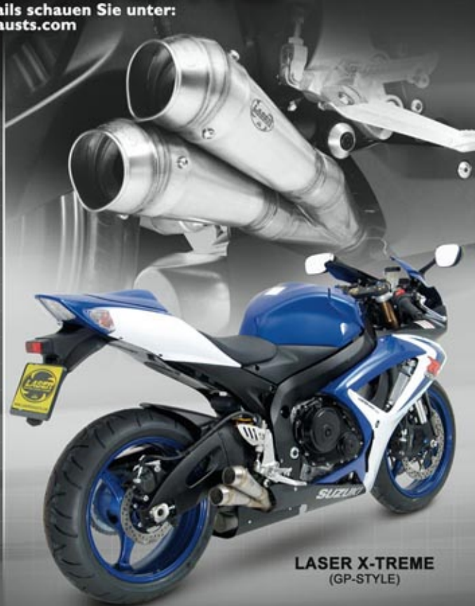
LASER X-TREME (GP-STYLE)