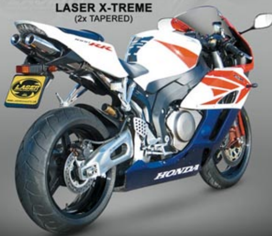
HONDA CBR1000RR '04