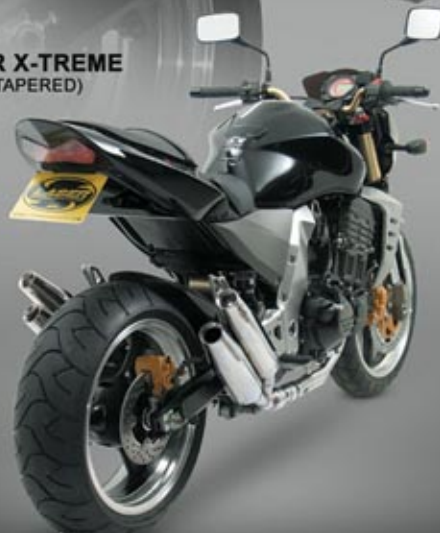
KAWASAKI Z1000 '03