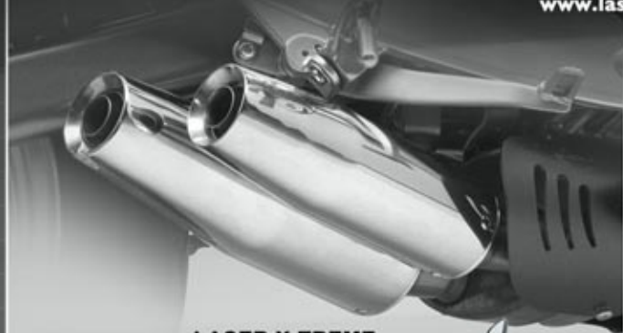
LASER X-TREME (2x TAPERED)

Für mehr Modelle und Details schauen Sie unter: www.laserexhausts.com