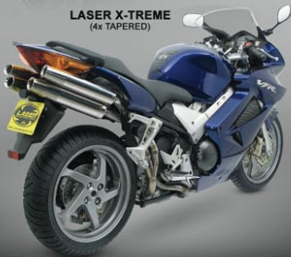
HONDA VFR800FI '02