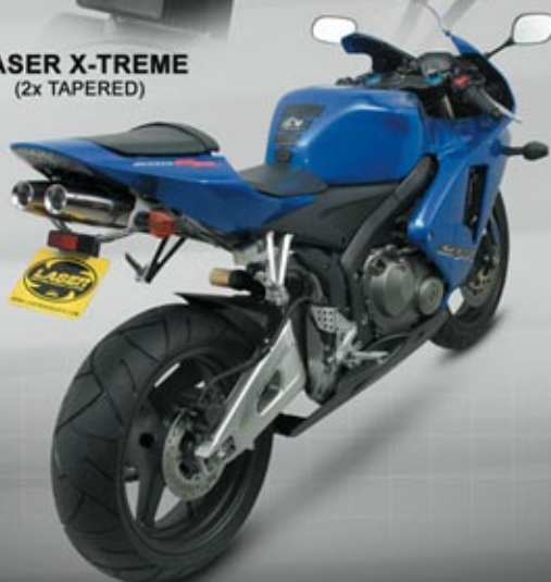
HONDA CBR600RR '05