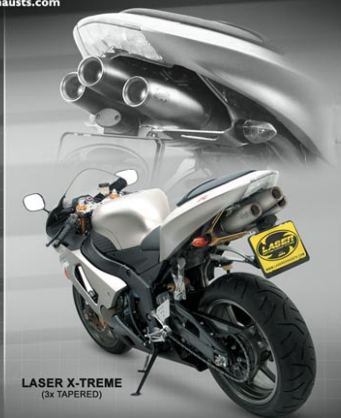
LASER X-TREME (3x TAPERED)