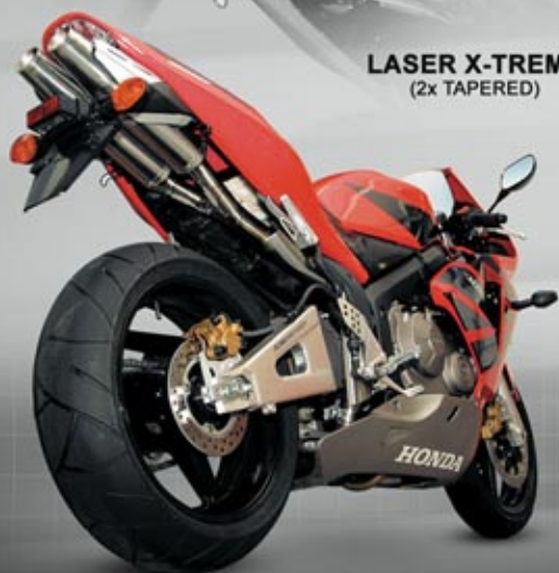
HONDA CBR600RR '03