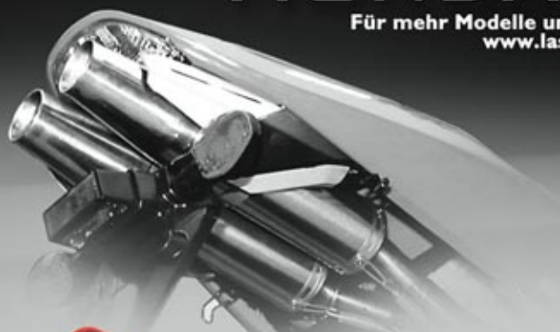
LASER X-TREME (2x TAPERED)

Für mehr Modelle und Details schauen Sie unter: www.laserexhausts.com