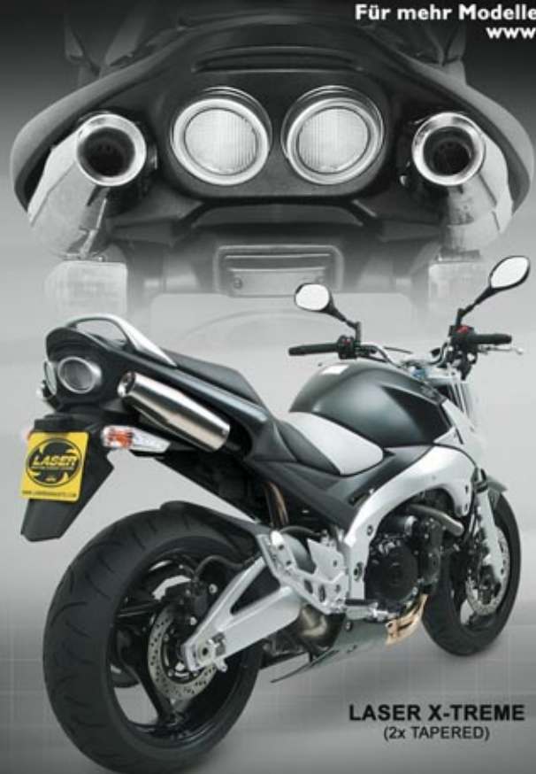
LASER X-TREME (2x TAPERED)

Für mehr Modelle und Details schauen Sie unter: www.laserexhausts.com