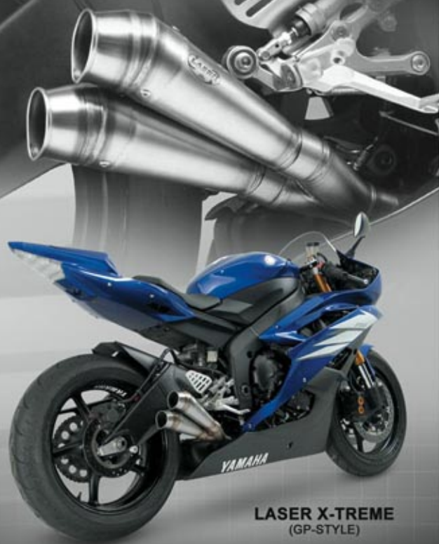
LASER X-TREME (GP-STYLE)