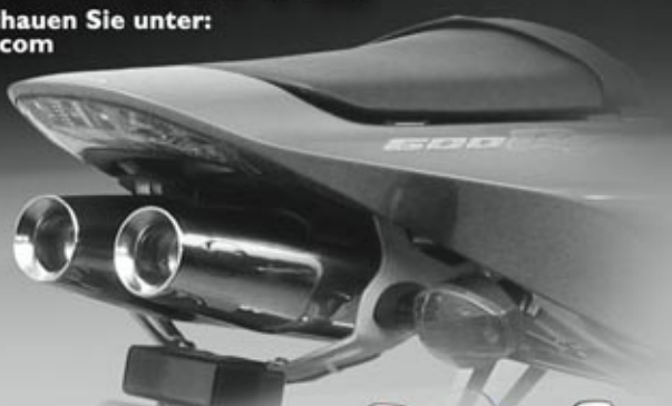
LASER X-TREME (2x TAPERED)