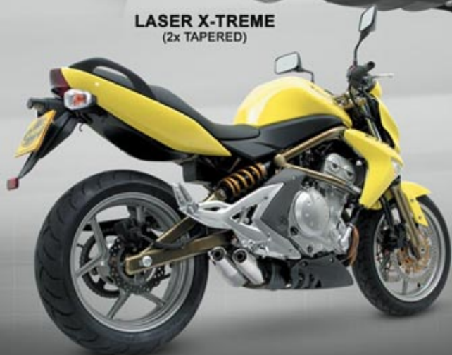
KAWASAKI ER-6N '05