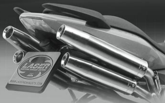
LASER X-TREME (4x TAPERED)