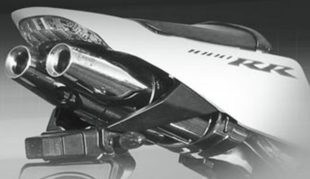
LASER X-TREME (2x TAPERED)