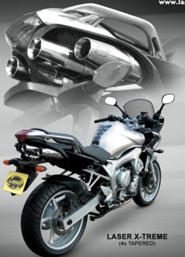
LASER X-TREME (4x TAPERED)

Für mehr Modelle und Details schauen Sie unter: www.laserexhausts.com